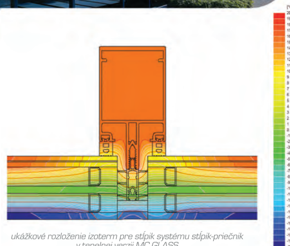
ukážkové rozloženie izoterm pre stĺpik systému stĺpik-priečnik v tepelnej verzii MC GLASS